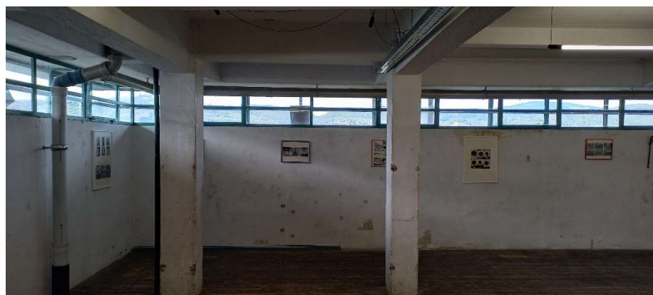
eine Ausstellung der ROSE im Atelierhaus am 07. Mai 2023

Die ROSE verfügt als Mieterin im Magazin 2 der Tabakfabrik konventionell über rund 650m 2 . Neben diesen Hauptflächen ist sie mit zwei Atelierflächen über 90m 2 im ehemaligen Magazin 1 auch Miet-Mitglied im Verein aller Kunstschaffenden dieses Hauses. In dieser Eigenschaft genießt sie auch sämtliche gemeinsam nutzbaren Räume wie Ausstellungs- und Veranstaltungsflächen, eine Werkstatt, Teeküchen, Umkleiden und Duschen.