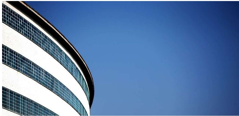
die Ikone Tabakfabrik

Raumumgebungen in ihren Alltag zu integrieren. Dabei ist der Umstand, dass die Schulleiterin Kunst studiert hat, ein wesentlicher Faktor. Spontane Selbst-Gestaltung führte in kompetenter Eigenregie laufend zu eigenständig schönen Verhältnissen. Vielmehr noch, es wuchs mit den Jahren eine gesamthafte Corporate Identity heran – Collage aus vorgegeben skurrilen Räumen, angekauften charismatischen Möbeln und gleichzeitig eingehaltenen Standards wurden zu einem Markenzeichen. Beides, das Mieten wie das Selbstgestalten, wurden nun am neuen Standort in der Tabakfabrik weiterentwickelt.