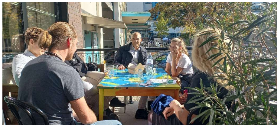
im Gespräch mit Future-Wings am 20. Oktober 2022