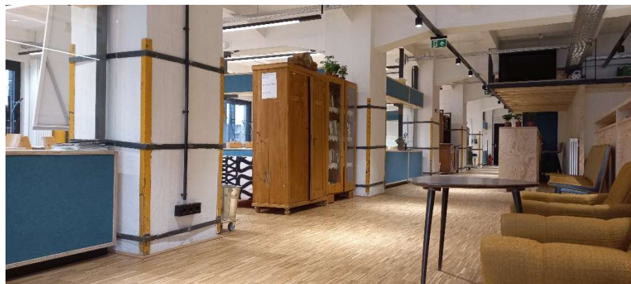
ausgesuchtes Mobiliar im Industriebau am 19. April 2022

Dieser Umgang mit Raum und Zeit(!) erfordern ein anderes Agieren als schulische – ja als lernende Organisation. Wendigkeit und Selbstständigkeit sind unabdingbare Voraussetzungen für eine derartige vierdimensionale „Assemblage-Plus“ über das Schuljahr hinweg. Auch laufende finanzielle Umsicht muss in die Routinen integriert werden. Aktuell benötigt die ROSE rund 12.000 Euro im Monat für ihre Raumversorgung, was im Mittel rund 100 Euro je Jugendlicher bzw. Jugendlichen und Monat an Schulgeld bedeutet.