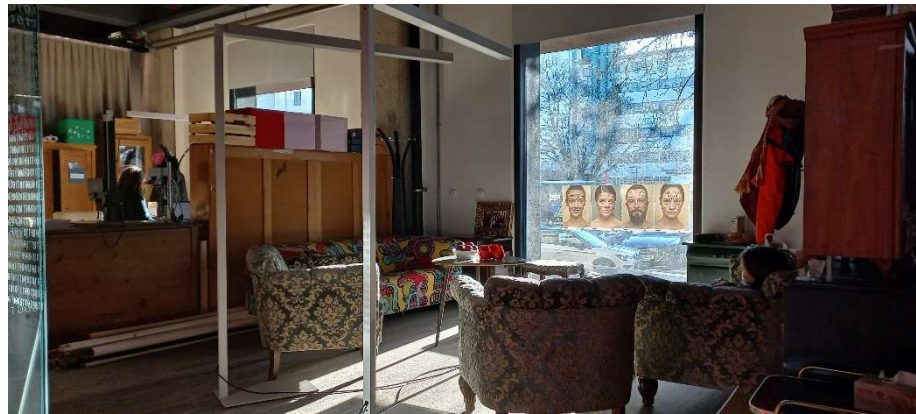
der Besprechungsraum im Provisorium © Michael Zimmer am 26. März 2022

Danach erlauben zwei 100-minütige Zeiträume ein vertieftes Arbeiten. Nach der Mittagspause wählen die Jugendlichen in den Lernateliers“ klassenübergreifend aus einem Pool an Angeboten je nach Interesse oder auch Förderbedarf individuelle Themen. Die regulären Wochentage enden schließlich mit einem letzten 100-Minuten-Block. Jedem Freitag werden nicht nur Klassen gemischt, sondern auch viele Fächer kombiniert, um gemeinsam mehrere je sechswöchige Projekte im Schuljahr zu entwickeln bzw. gestalten. Die Projektfächer „Verantwortung“, „Herausforderung“ und „Ab-ins-Ausland“ finden darüber hinaus individuelle Zeitformen durch das ganze Kalenderjahr hinweg. Hinzu kommt noch das Matura-Jahr, das aufgrund einer umstrukturierten Stundentafel den Jugendlichen eine klausurale Zeit der Konzentration auf wenige relevante Fächer ermöglicht.