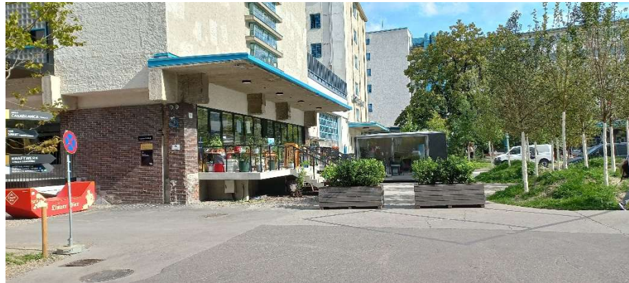
am Vorplatz der ROSE am 14. September 2022

Im Winter steht die Eishalle zur Verfügung. Die weitläufigen Strände an der Donau bieten sich zum Laufen an, im Winterhafen wird im selbstgefertigten Kanu gepaddelt. Schließlich runden noch Nutzungsvereinbarungen für Turnhallen und Labors mit zwei nahegelegenen Schulen innerhalb eines Radius von fußläufigen sieben Minuten diese Raumpolitik ab.