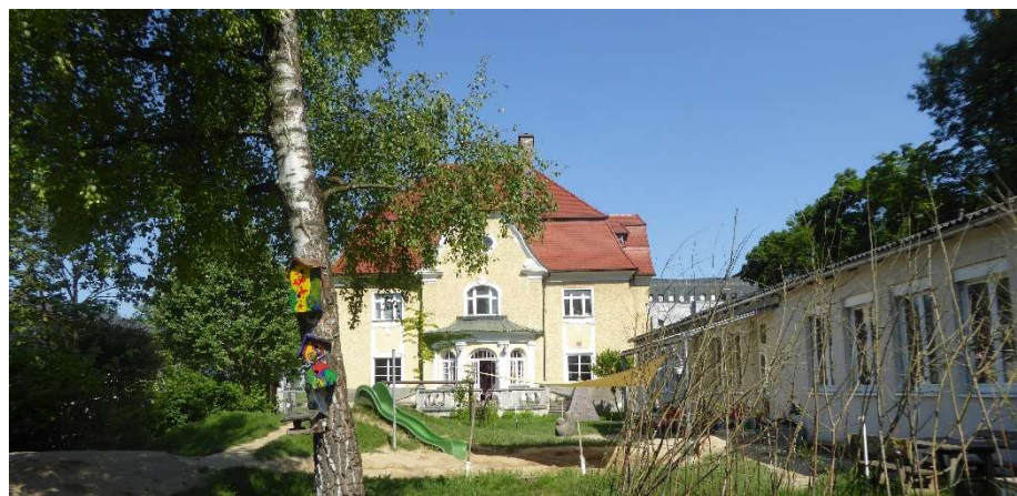
die Villa als Schulhaus © Michael Zimmer am 04. Juni 2015

Seit ihren Anfängen musste sich die ROSE mit unterschiedlichsten räumlichen Gegebenheiten arrangieren. Hatte sie sich in den beiden ersten Jahren das Erdgeschoss einer Villa aus dem 19. Jahrhundert eingewohnt, so richtete sie sich danach in den Büroräumen des ehemaligen AMS in Steyr aus den 1960er-Jahren ein. Mit den Lagerhallen in der Tabakfabrik landet die ROSE nun in der Moderne der 1920er Jahre.