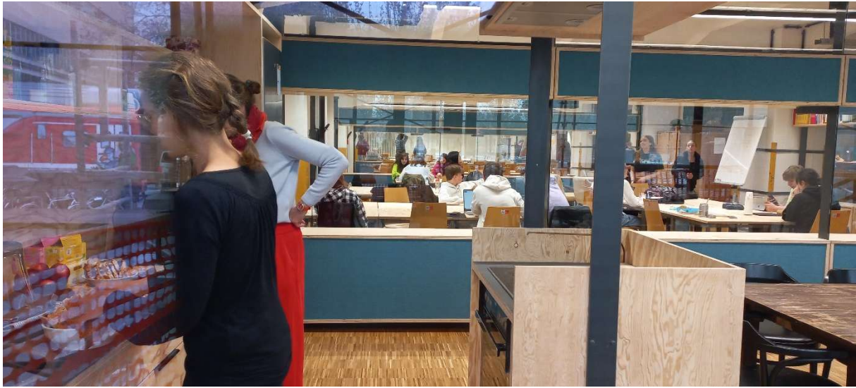
in der Küche am Morgen am 19. April 2022