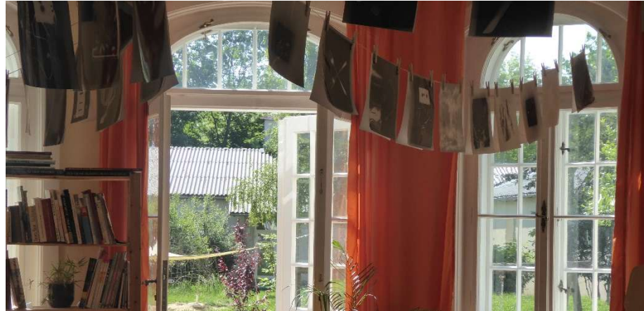
ein Blick in den Garten © Michael Zinner am 04. Juni 2015